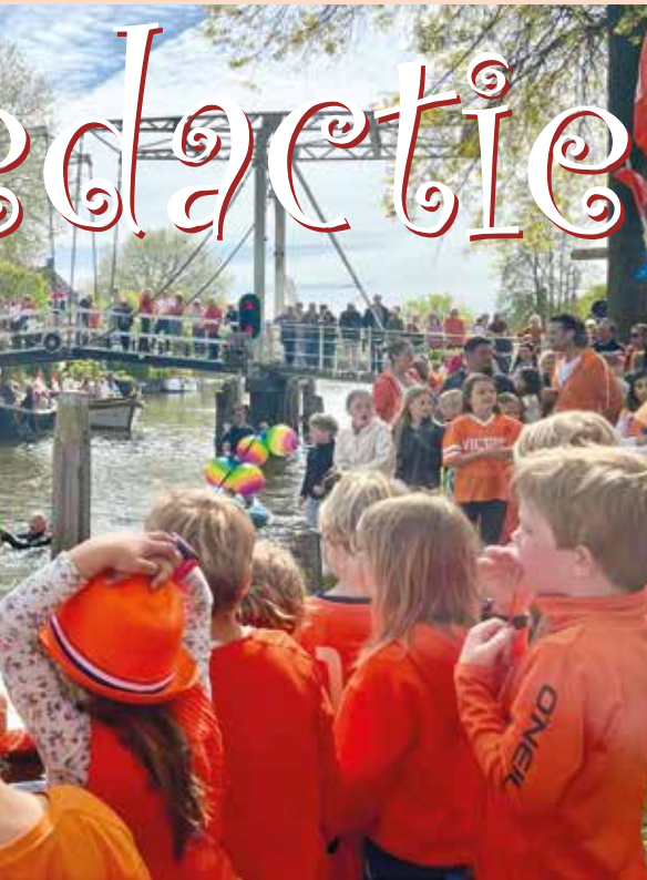
Weer veel natte pakken tijdens het Waterspektakel van Koningsdag! Wie durft er volgend jaar?