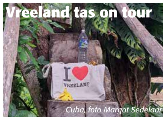
Cuba