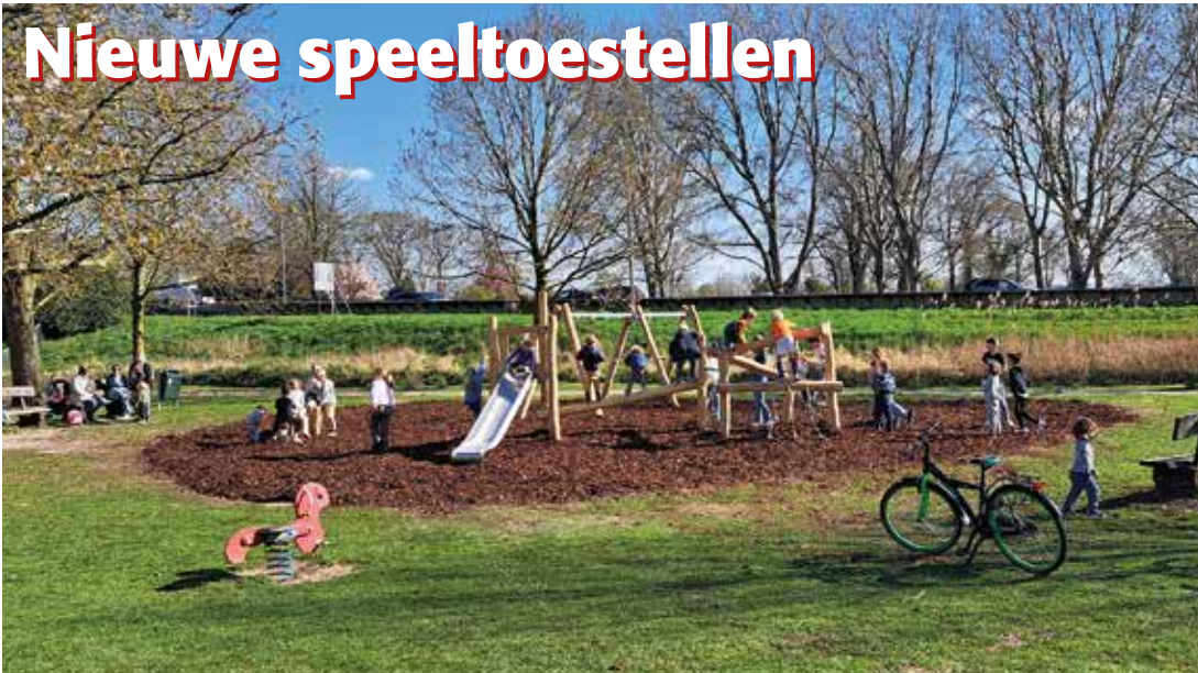
De nieuwe speeltoestellen achter CSV Ridderhof zijn meteen al een groot succes!