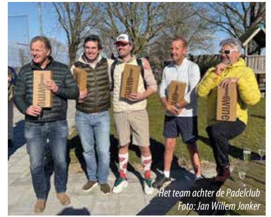
Het team achter de Padelclub

Op zondag 16 maart is de Loenense padelclub op sportpark De Heul officieel geopend door wethouder Karin van Vliet. De nieuwe padelvereniging is in korte tijd uitgegroeid tot een bloeiende community van 300 leden, met nog eens ruim 200 enthousiaste aanmeldingen op de wachtlijst. Ruim honderd leden waren afgekomen op dit feestelijke moment, met onder andere een padelclinic. Kijk voor meer informatie over de padelclub op www.loenensepadelclub.nl .