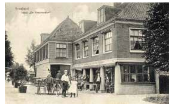
Eén van de Pubquizvragen gaat over De Nederlanden...

De Historische Kring Loenen bestaat dertig jaar! Om dat te vieren worden er allerlei evenementen georganiseerd, waaronder een Jubileum Pubquiz in samenwerking met het Oranjecomité Loenen op 1 mei in de Oranjentent op het Doude van Troostwijkplein. Voorafgaand aan de quiz geeft Orveo een voorjaarsconcert, dus komt allen om 19.00 uur naar de feesttent op het Doude van Troostwijkplein in Loenen. Alleen voor het concert of de quiz komen kan natuurlijk ook, inschrijven voor de quiz kan om 20.00 uur. De jarige HKGL biedt het eerste drankje aan.