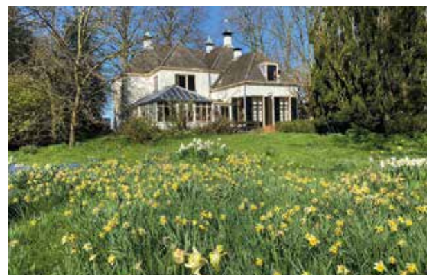
Narcissen in de achtertuin van Vreedenhorst.

In de tuinen en parken van de vele buitenplaatsen langs de Vecht zijn heel veel soorten te bewonderen. Het dichtstbij is Vreedenhorst aan de Bergseweg, maar door iets verder te fietsen vind je ze volop in de openbaar toegankelijke parken van Goudestein, Gunterstein en Sterreschans of van de kastelen Zuylen en Loenersloot. Spectaculaire paarse gazons die je vanaf de weg goed kunt bekijken zijn de tuinen van Gansenhoeft en Leeuwenburg in Maarssen.