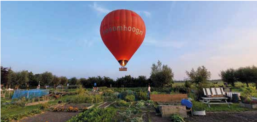
Een luchtballon zweeft boven de moestuinen van de volkstuintvereniging. Wat een plaatje! Er is weer plek bij de tuinen voor nieuwe leden.

Gratis maandelijks huis-aan-huis blad voor Vreeland • Jaargang 16 • nr. 11 • februari 2024 • info@vreelandbode.nl