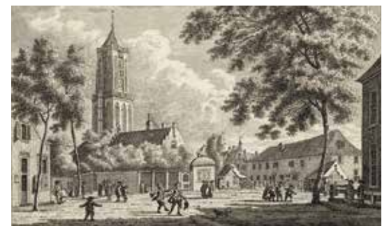
Prent van 't dorp Loenen uit ongeveer 1780.