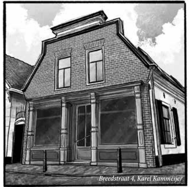
Breedstraat 4, Karel Kammeijer