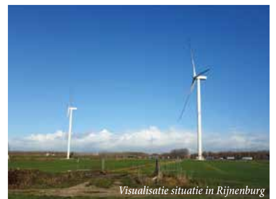
Visualisatie situatie in Rijnburg

Vul dan voor 29 oktober de vragenlijst in via https://utrechtwind.raadpleging.net/ . In deze raadpleging willen we weten wat u in het algemeen be-