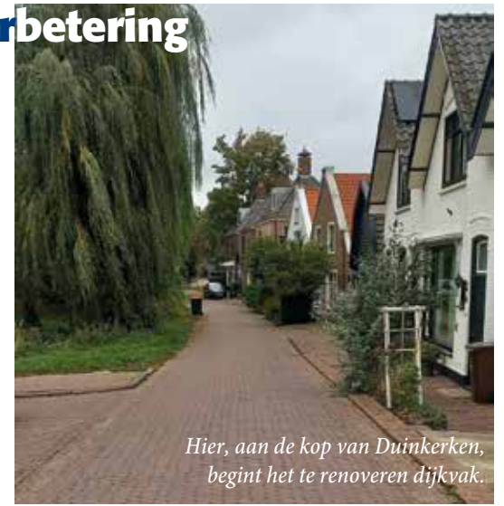
Hier, aan de kop van Duinkerken, begint het te renoveren dijkvak.

Waternet werkt in opdracht van Waterschap Amstel, Gooi en Vecht aan de voorbereiding van de dijkverbetering Nigtevechtseweg-Zuid. Ook de Gemeente Stichtse Vecht is betrokken bij dit project. Uit onderzoek is gebleken dat de dijk niet aan de veiligheidseisen voldoet. Het traject loopt van Duinkerken (vanaf de N201) via de Boterweg t/m Nigtevechtseweg 31. De dijk Nigtevechtseweg-Zuid is een regionale waterkering (ook wel 'secundaire' waterkering genoemd) en beschermt het achterland van de polder Holland, Sticht, Voorburg en polder het Honderd oost.