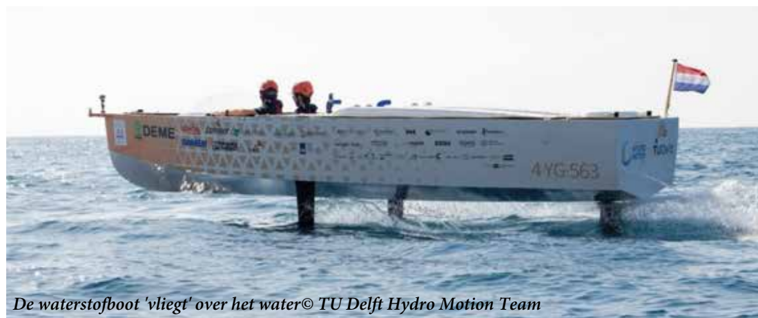
De waterstofboot 'vliegt' over het water