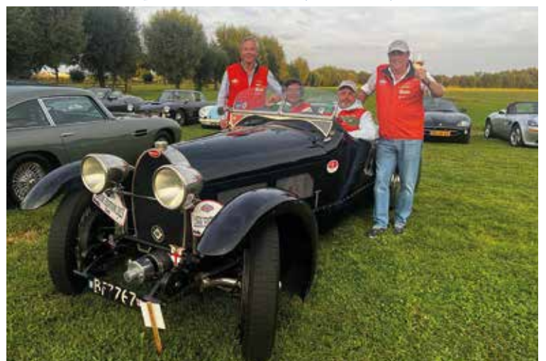
De rallyorganisatie in een Bugatti, die de prijs Mooiste klassieker won.

Zo'n vijftien (oud)Vreelanders reden afgelopen weekend mee met de Vechtstreek Classic rally. De lustrumeditie met maar liefst 75 equipes werd onder uitstekende omstandigheden gereden, met als start- en eindpunt Stalhouderij De Zadelhoff in Breukelen. Vanuit de organisatie is een bijdrage gedaan aan het Cultuurfonds Stichtse Vecht.