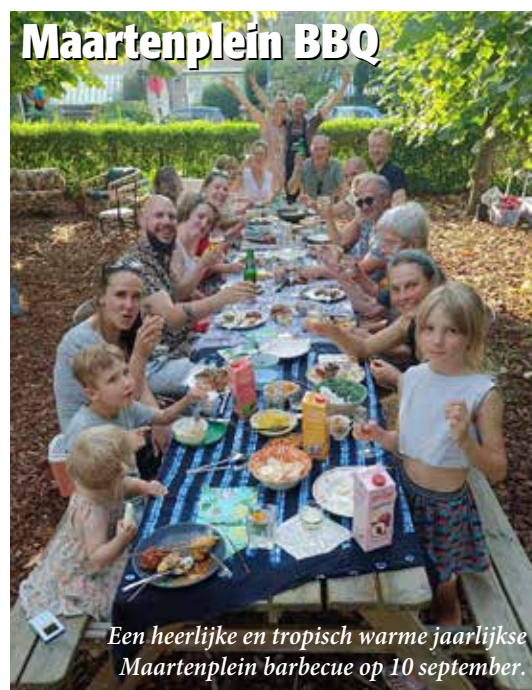
Een heerlijke en tropisch warme jaarlijkse Maartenplein barbecue op 10 september.