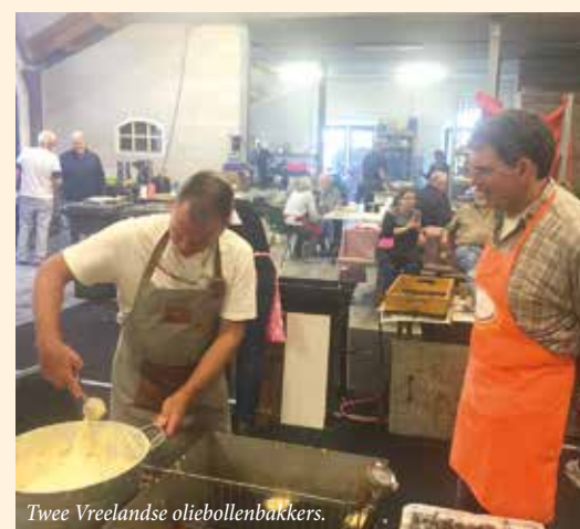
Twee Vreelandse oliebolletjesbakkers.

Ieder jaar is er de oliebolactie, waarbij vele vrijwilligers in Loenen oliebolletjes bakken die huis-aan-huis verkocht worden en waarvan de opbrengst is bestemd voor een dagje uit voor de senioren uit Loenen en Vreeland. Vanwege de onzekerheid rondom de coronamaatregelen werd dit jaar pas op het laatst besloten de actie door te laten gaan, waardoor de vrijwilligers uit Vreeland verstek moesten laten gaan. Er zijn dan ook dit jaar in Vreeland geen oliebolletjes verkocht, en dat vinden wij erg jammer. We hopen dat er volgend jaar weer zoals vanouds ook in Vreeland weer veel mensen kunnen smullen van de verse en met liefde gebakken oliebolletjes! En dat de senioren uit onze dorpen dus weer een leuk dagje uit kunnen.