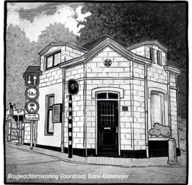
Brugwachterswoning Voorstraat, Karel Kammeijer

Alle informatie en de voortgang is te vinden op: www.toekomstN201.nl . Lees verder op pagina 4