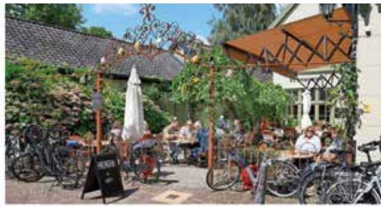
TERRASSENTEST: Perfecte pannenkoek bij Hendrik in Vreeland