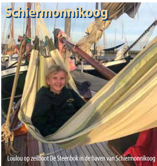
Loulou op zeilboot De Steenbok in de haven van Schiermonnikoog