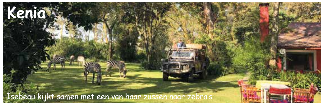
Isebeau kijkt samen met een van haar zussen naar zebra's