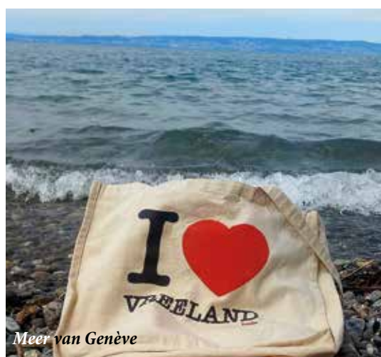
Meer van Genève