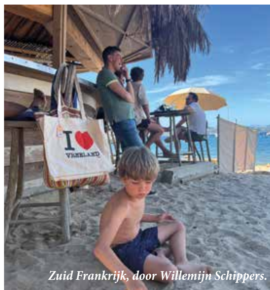
Zuid Frankrijk, door Willemijn Schippers.

B E L L E Z A haarmode Dames - Herenkapsalon "Achter elk persoon staat een kapper die van haar houdt"