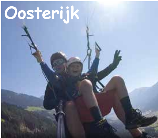
Als je oom paraglidinginstructeur is in Oostenrijk, kan het zomaar gebeuren dat je zelf óók de lucht in gaat. En zelf mag sturen!