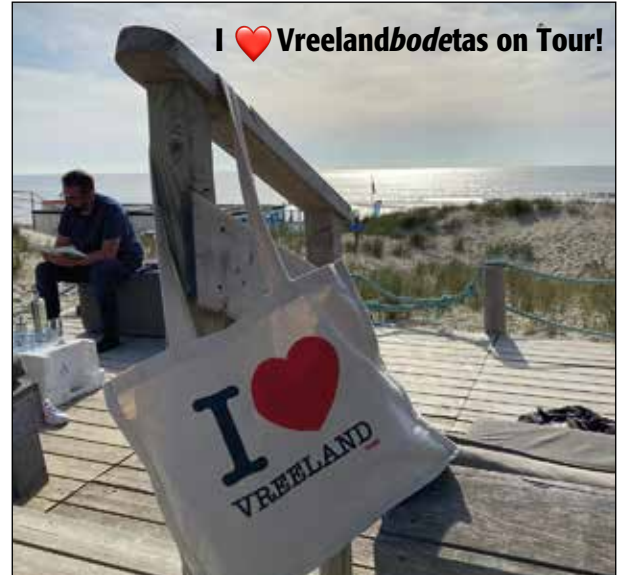
I ❤️ Vreelandbodetas on Tour!

Tot onze blijde verrassing stond er twee weken geleden ineens een stuk vangrail tussen een deel van de N201 en het naastgelegen fietspad. De Dorps-