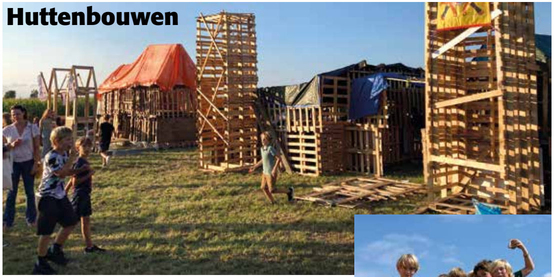
Het huttenbouwkamp 2022 was weer een doorslaand succes!