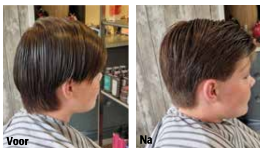
Opgeschoren kapsels zijn verleden tijd

warmer van kleur. De contrasten worden ook groter en er komt meer levendigheid in het haar door combinaties te maken van highlights (lichte kleuren op donker haar) en lowlights (donkere kleuren op lichter haar)”.