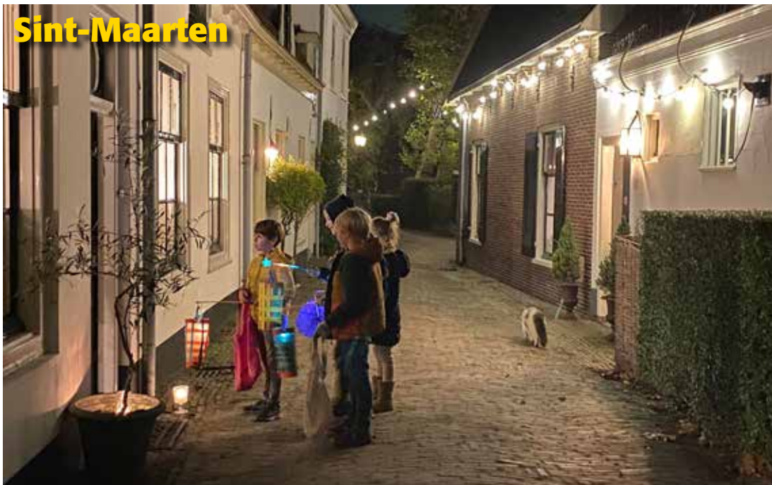
Gelukkig kon Sint-Maarten goed gevierd worden! Tientallen kindertjes liepen met hun lampion door het dorp en zongen uit volle borst. Ze werden goed beloond voor hun inzet.....