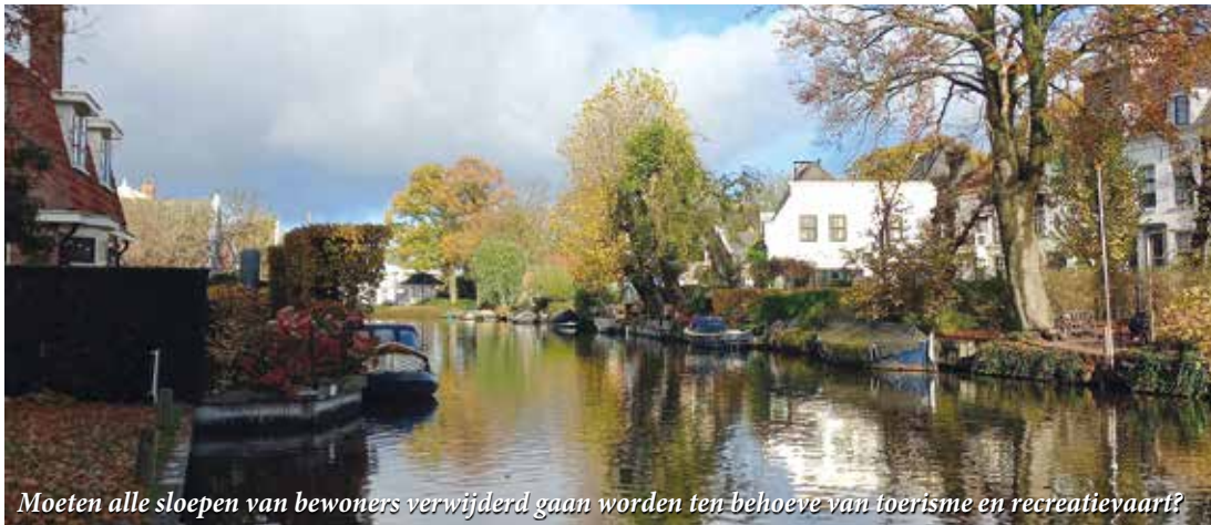
Moeten alle sloepen van bewoners verwijderd gaan worden ten behoeve van toerisme en recreatievaart?

Na bijna twee jaar stil te hebben gelegen is er plotseling beweging gekomen in het bestemmingsplan waarin de regels voor boten en vaarverkeer op de Vecht worden aangepast. De Dorpsraad heeft, evenals vele bewoners, begin 2020 een zienswijze ingediend op de plannen waarin we onze grote zorgen en bezwaren uiten op de voorgestelde veranderingen. Het bestemmingsplan houdt kort gezegd in dat er strengere regels komen voor boten van bewoners, maar ruimere regels voor commerciële vaart en toeristen. Bewoners zullen daardoor boten moeten weghalen omdat ze te groot zijn binnen de nieuwe normen of omdat er meer ruimte moet komen voor vaarverkeer, terwijl dat vaarverkeer juist groter en meer mag worden. Dit is in tegenpraak met de wensen van bewoners maar ook met de eigen beleidsplannen