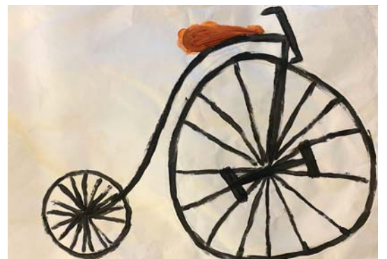
Velocipede, groep 4

toen wert vor het eerst een fiets uit gevonden. dit wert bedagt door iemand uit duitseland. de fiets waseen loopfiets gemaakt van hout. de wielen waren ook van hout. je kwam vooruit door met je voeten op de grond af te seten. deesen fiets kon alleen maar regt door. waarom wand deesen fiest hat nog geen stuur. later bedagt iemand een loopfiets met stuur.met dit stuur kon je bogte maake. deese fiets was ook nog van hout en hat ook nog geen trapers. de wielen haden meer spaken dan de eerste loop fiets. sas dit al een egte fiets? nee. ne derde fiets was de velocipede. deze fiets wert bedag dor twee mensen uit frankrijk. deese fiets hat trapers en de wielen waaren van ijzer. het vorwiel was ietsjes grooter dan het agterwiel. de mensen kwamen ergens agter. hoe grooter je vor wiel was hoe sneler je ging. dus bedagten ze een fiets met een heel groot vor wiel. deze fiets werd de hogen bi genoemd. hij geeng super snel. alleen op en af stapen was heel moeilijk omdat hij zo hoog was. en deesen fiets had lugt in de banden.