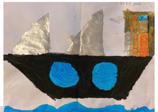
Taeke en Jesse, groep 4

heel vroeger waren er nog helemaal geen fietsen. vroeger gingen mensen op reis met bijvoorbeeld een boot