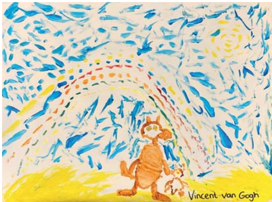
Vincent van Gogh