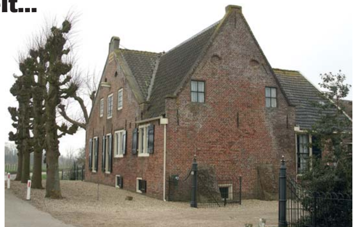
Boerderij Altoos Dankbaar.