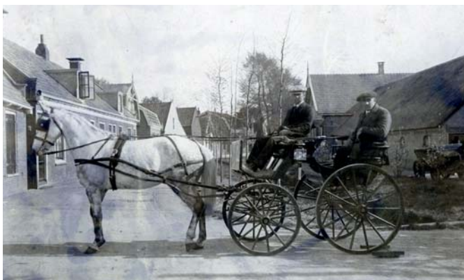
Zicht op boerderij Ora et Labora aan de Boterweg.