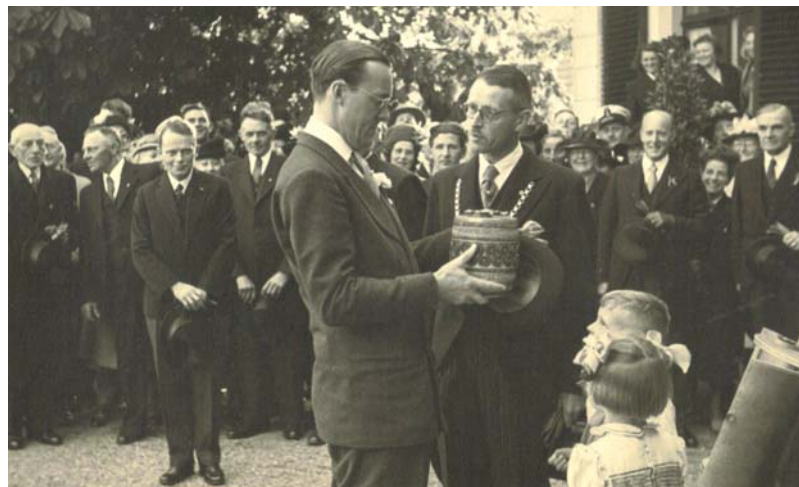
Op 25 mei 1949 ontving Prins Bernhard in Vreeland uit handen van burgemeester Sprenger een tabakspot gemaakt door de Vreelandse kunstenaar Pieter van Gelder die op Schoonoord woonde. (Coll. Mooij)

Om aanwezig te zijn bij de Lustrumavond kan men zich, bij voorkeur, aanmelden via onze website, www.hkloenen.nl . Indien dit niet mogelijk is kan men zich ook telefonisch aanmelden via: 06-24129969. Voor leden is de toegang gratis; introducees betalen € 10,- per persoon. Gelieve dit bedrag over te maken op: NL53 RABO 0310 6540 17 t.n.v. Historische Kring Loenen o.v.v. 'Lustrumavond'. Wij hopen u in groten getale te verwelkomen!