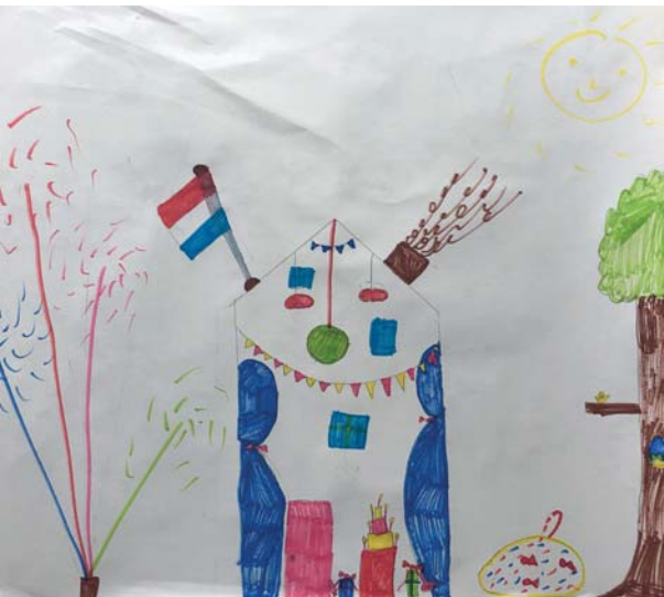
Liz, groep 4

...en keertje mee doet met de Kids-redactie. 14:15 – 15:30. Kom je ook of stuur je liever wat in? Dan kijken wij of er die maand nog plek is of dat de maand. Je komt altijd aan de beurt!