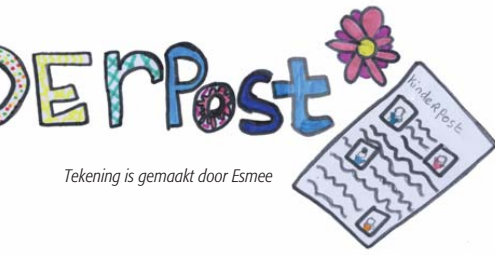
Tekening is gemaakt door Esmee