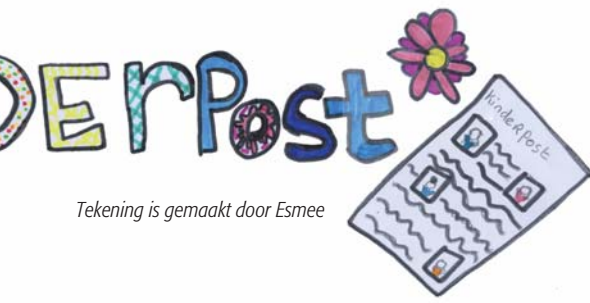
Tekening is gemaakt door Esmee