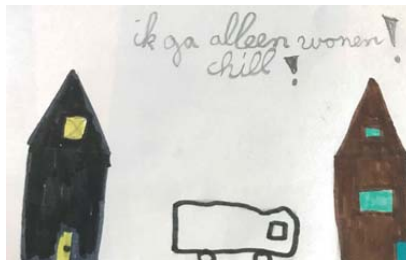
Ik ben nu 21 ga alleen wonen chill! Ik ga wel me zusje missen! :--( Ben nu 41 ik ga trouwen!