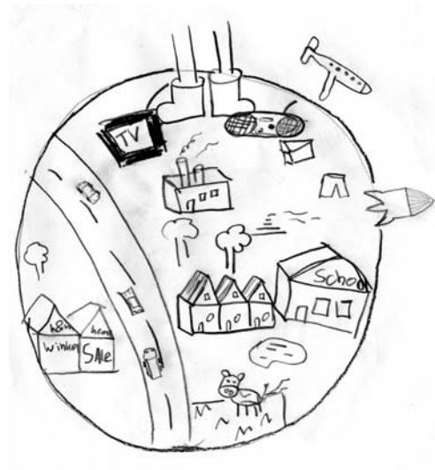
Getekend door Swaan Bongers