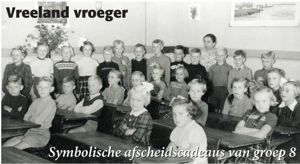
Symbolische afscheidscadeaus van groep 8