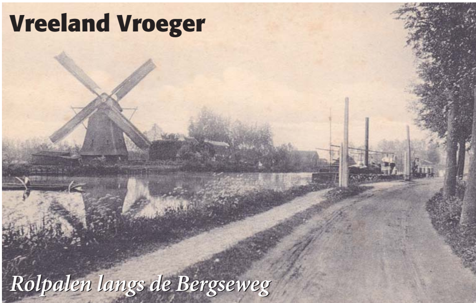
Rolpalen langs de Bergseweg

Op de oude foto van voor 1910 zien we een deel van de Bergseweg ter hoogte van het huidige Greif. Aan de overkant van de Vecht ligt molen De Ruiter. De oude molen overigens, die in 1910 is afgebrand waarna de huidige molen op deze plek is opgebouwd.