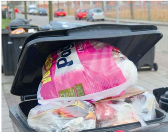
Dit soort situaties zijn dus binnenkort verleden tijd.

Vanaf het najaar zullen de Vreelanders nog meer dan zij wellicht gewend zijn hun afval moeten scheiden. De grijze container voor restafval gaat vanaf dan gebruikt worden voor plastic. De papier- en groenbakken blijven in gebruik zoals gewoonlijk, maar het restafval dat tot dan toe in de grijze bak ging, moet nu zelf worden weggebracht naar een inzamelstation. De locatie hiervan is nog niet bekend. Dit zal een grote verandering betekenen voor veel mensen. In de volgende Vreelandbode leest u meer over deze duurzame ontwikkeling.