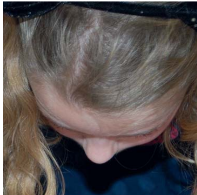
Van wie is deze neus?