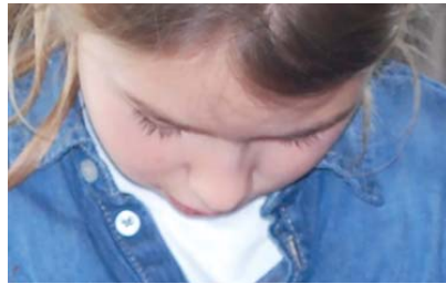
Van wie is deze neus?