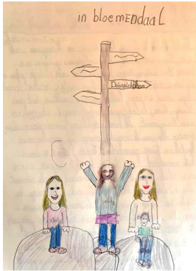
Eva v.d. Mijn zomervakantie.

Toen de vakantie begon bleven we eerst nog een week thuis. Toen eindelijk die week voorbij was gingen we naar Basievierde, daar hadden we een huisje gehuurd. Er was een zwembad en als je verder naar beneden liep was er een hele grote speeltuin met een trampoline, kabelbaan, hobbelpaard, schommel en een hangmat. Ik had een klavertje vier gevonden maar die was ik vergeten, maar bij opa en oma had ik er twee gevonden. Toen zaten we aan het zwembad en toen kocht papa even een stuk grond in Bloemendaal in de straat Duinzichtlaan. Aan het strand. Ik mag in een kamer slapen waar je de duinen kan zien. Toen die 2 weken om waren in Basievierde gingen we naar opa en oma. Daar hebben we ook vaak gezwommen. En Filou dat is een hond en die was er ook. En we hebben ook veel met Filou gespeeld. En opa snurkt in de hangmat als wij aan het zwemmen zijn. Opa en oma hebben ook een boomhut daar hebben we ook vaak in gespeeld. En toen we terug naar huis gingen dacht mama dat we de speen van Max waren vergeten maar die hebben we weer gevonden. Einde