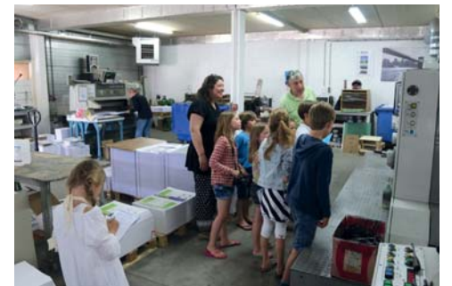
Het drukken begint. Laure: "Het stinkt wel een beetje maar ja..."

we een hele oude druk machine. Die was super. Door jullie verslaggever ter plaatse Sam Fremeijer.