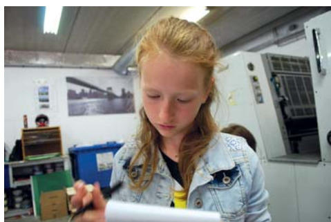
Anne druk bezig: "Wat kan ik nog vragen...?"