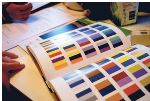
Voor de koppen een nieuwe kleur...? kies maar!