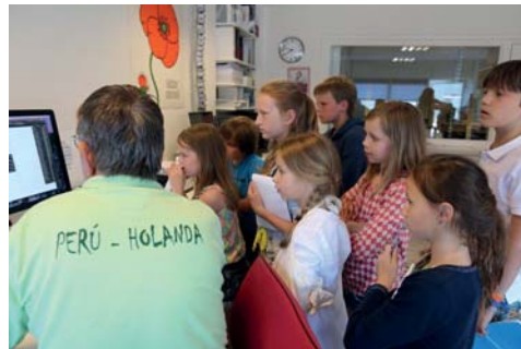
Het begint met de opmaak op de computer

Op 7 juni 2016 gingen de razende reporters naar de drukkerij van de vreelandbode.