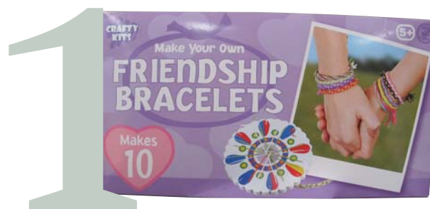
Vriendschaps armbandjes € 4,75