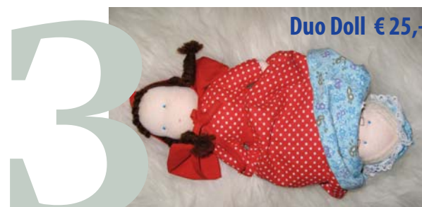
Duo Doll € 25,-