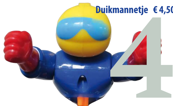
Duikmanneltje € 4,50