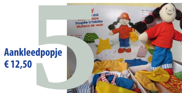
Aankleedpopje € 12,50