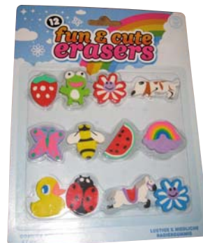
Grappige gummen € 1,75